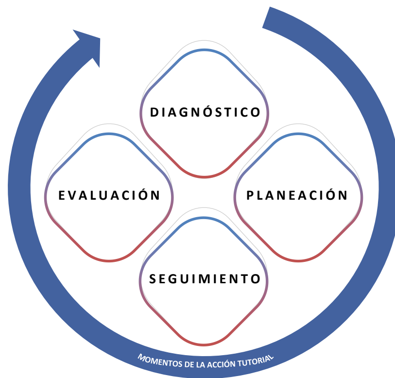
Ilustración 6 - Momentos a considerar para el desarrollo de las acciones tutoriales.