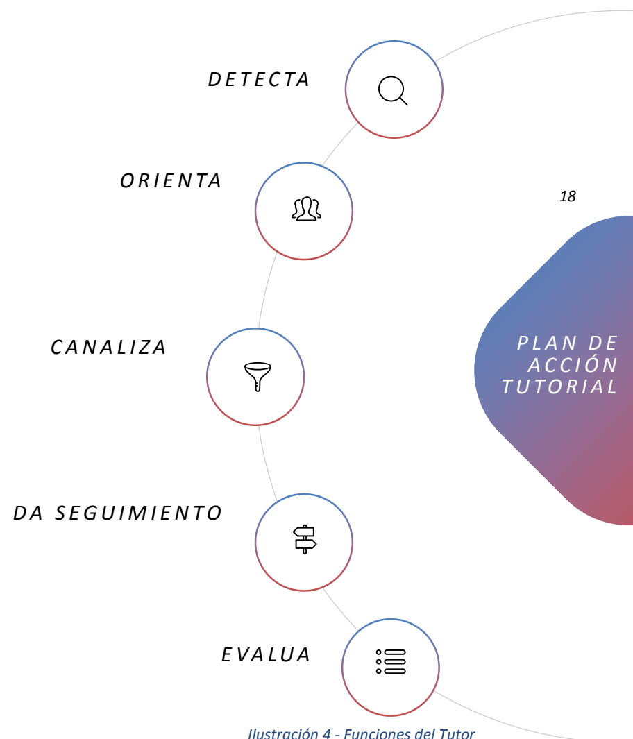
Ilustración 4 - Funciones del Tutor