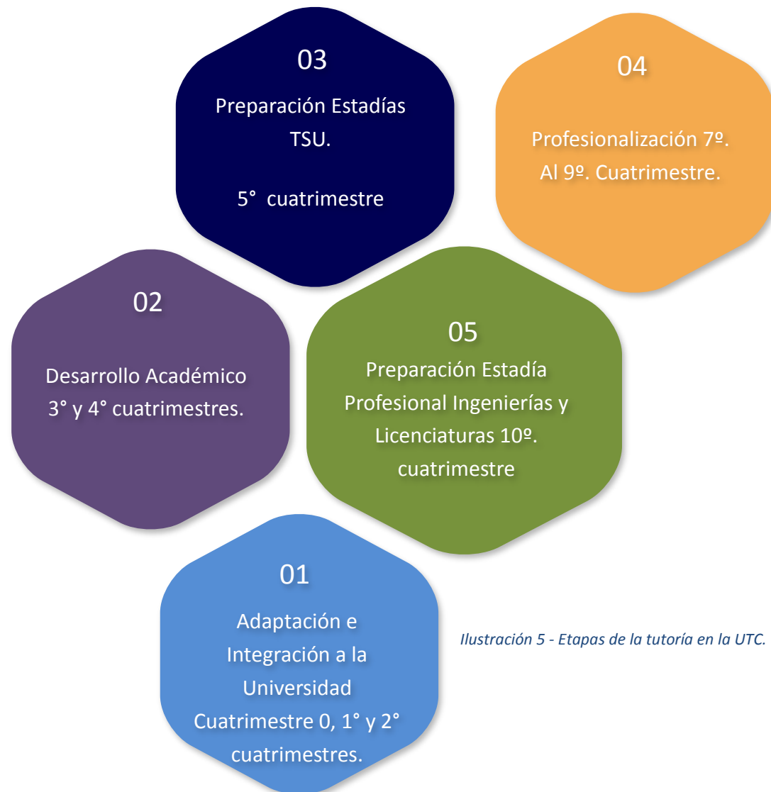
Ilustración 5 - Etapas de la tutoría en la UTC.

El proceso de acompañamiento que los tutores realicen no debe ser improvisado, ya que deben contemplarse actividades sistemáticas que permitan la atención de necesidades además de considerar la etapa de la tutoría de acuerdo al cuatrimestre.